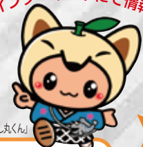
鹿島市イメージキャラクター「かし丸くん」