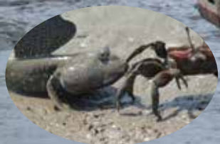
干潟の祭典 鹿島ガタリンピック