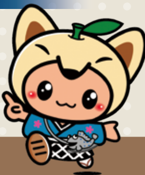
～鹿島市イメージキャラクター～ かし丸くん