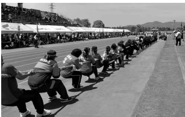
ケーブルテレビで、当日生中継。 後日、録画放送もされます。

詳しくは 鹿島市体育協会 ☎0954(62)3379 http://www.asunet.ne.jp/~taikyou/