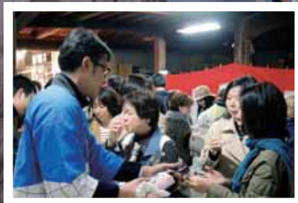
各蔵自慢の新酒に舌鼓