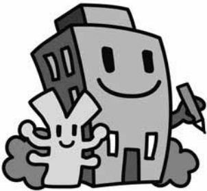
☑経済センサスキャラクター