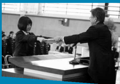
卒業証書を受け取るクラス代表生徒

鹿島高校では3月1日(火)、第68回卒業証書授与式が行われました。卒業証書授与では、担任の先生が卒業生1人ひとりの名前を読み上げると、高校生活最後の日を迎えた3年生が元気よく返事をし、クラス代表の生徒が卒業証書を受け取りました。