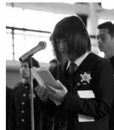
答辞を述べる卒業生代表

鹿島高校生として3年間で学んだことを胸に、これからの人生を精一杯頑張りたいと思います。