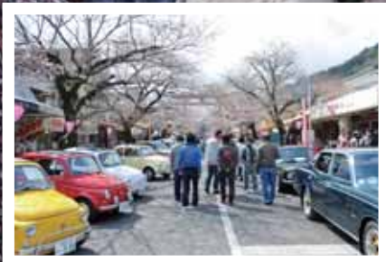
祐徳門前春まつり