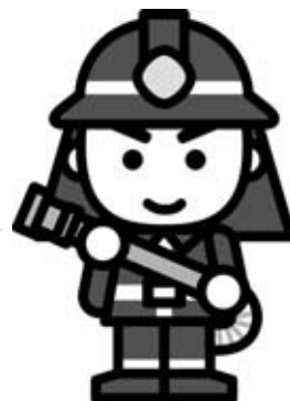
☑消太くん 全国消防イメージキャラクター