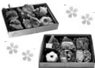
☒ 2日間限定“祐徳彩りいなり弁当”(参道の花見会場で販売)