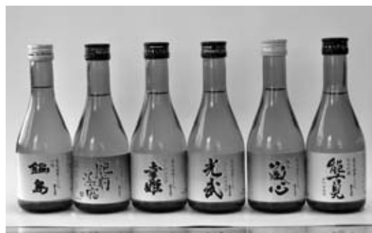
☒ ツーリズムオリジナルの6蔵セット(イメージ)