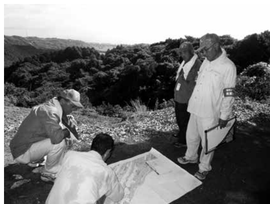
☑過去の農地パトロール

①地域の農地利用の確認 ②遊休農地の実態把握と発生防止・解消 ③違反転用発生防止・早期発見を行い、地域の農地の状態を把握する取り組みです。人であれば、診察を行ってカルテを作るようなものです。処方箋（＝対応策）を考える上で不可欠な基礎情報の収集活動になります。