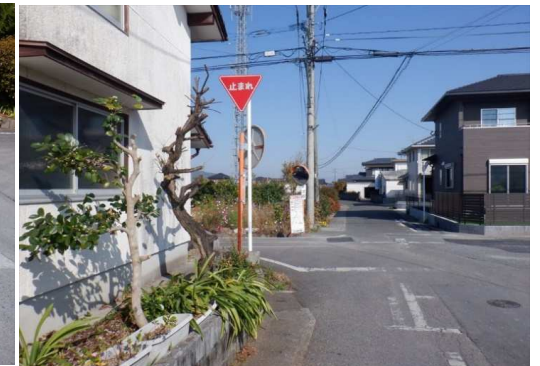
23. 明倫小学校 アメリカパン北側交差点 植栽剪定