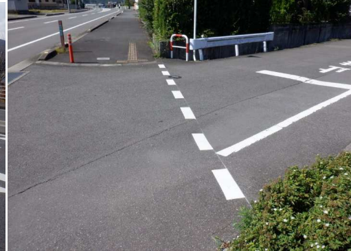
18. 明倫小学校 国道444号 ことじ保育園付近 歩道外側に白線設置