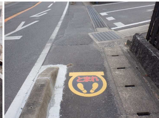
12. 浜小学校 市道臥龍ヶ岡公園線 止まれマーク設置