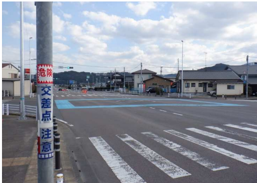
17. 明倫小学校 207号バイパス 辻交差点付近 交差点にカラー舗装、「スピード落とせ」の路面標示、減速マーク設置