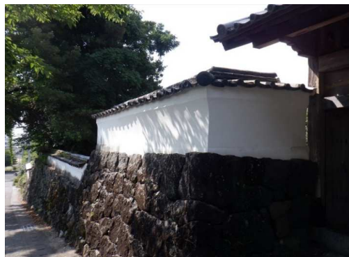
3. 鹿島小学校 武家屋敷通り 白壁補修