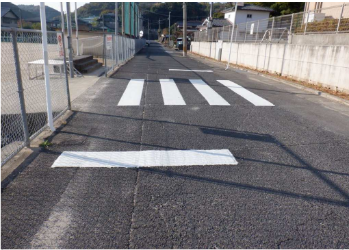
24. 東部中学校 校舎と運動場の間 横断歩道の補修