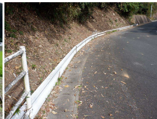
8. 能古見小学校 蟻尾山から片山橋まで の道路の土砂止め対策