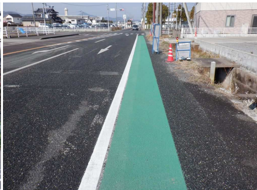
11. 浜小学校 国道207号浜三ツ角 歩道部分にカラー舗装設置