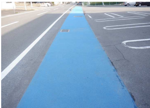
1. 鹿島小学校 横田セブンイレブン前 歩道水たまり対策、カラー舗装補修