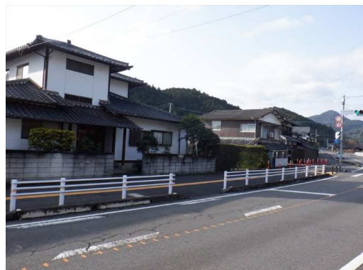
5. 能古見小学校 校門前 ガードレール設置