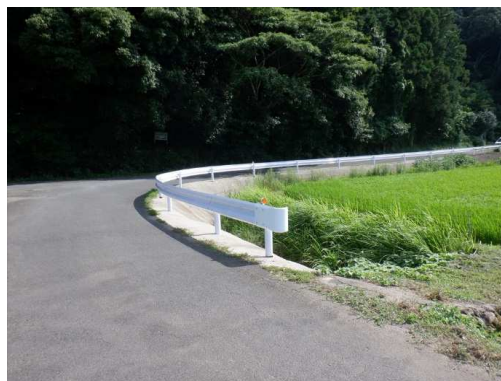
7. 能古見小学校 国道444号から鹿島療育 園へ向かう道路にガードレール設置