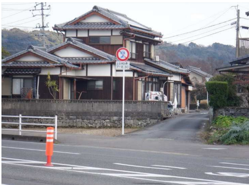
10. 古枝小学校 国道207号バイパス 久保山交差点付近 車両通行止めの規制