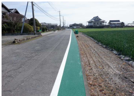
13. 北鹿島小学校 東側市道 歩道部分にカラー舗装設置