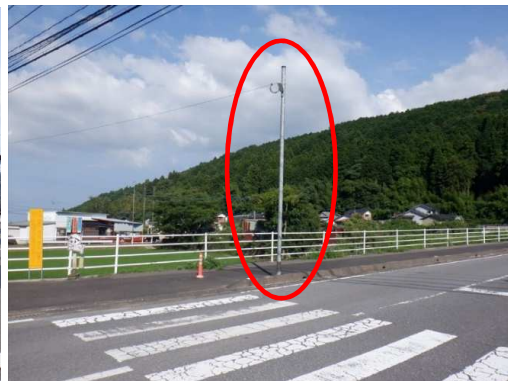
6. 能古見小学校 三源寺トンネル付近 防犯灯設置