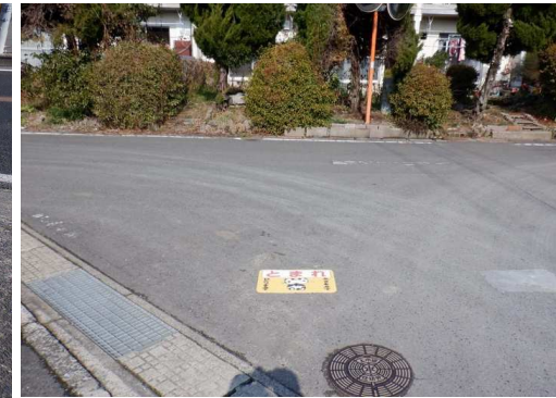
22. 明倫小学校 市道井手分住宅2号線 止まれシール張り直し