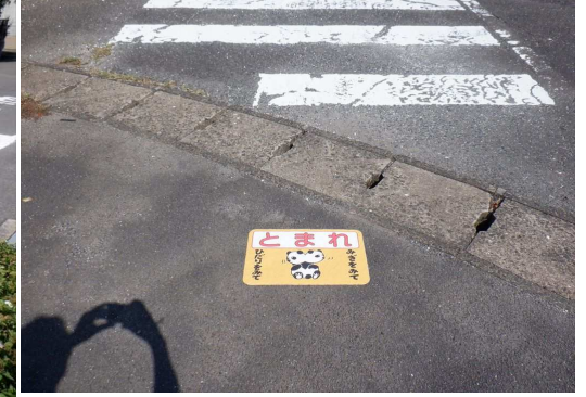
19. 明倫小学校 市道小舟津広瀬線 峰松鮮魚前交差点 止まれシール張り直し