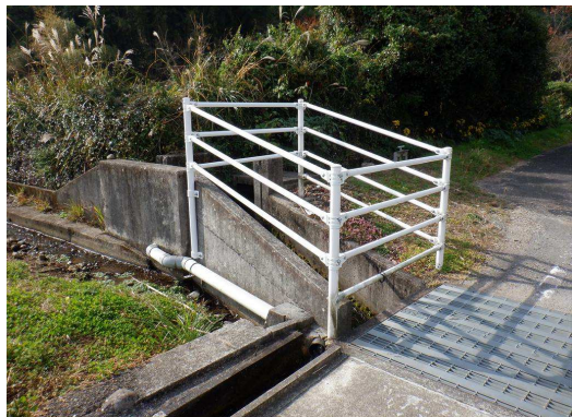
9. 能古見小学校 筒口から小学校方面への通学路途中にある水路に転落防止柵設置