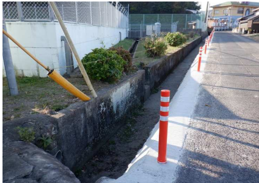
25. 東部中学校 テニスコート横 ラバーポール設置