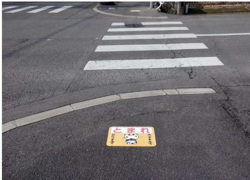
20. 明倫小学校 市道小舟津広瀬線 祐徳温泉西側交差点 止まれシール張り直し