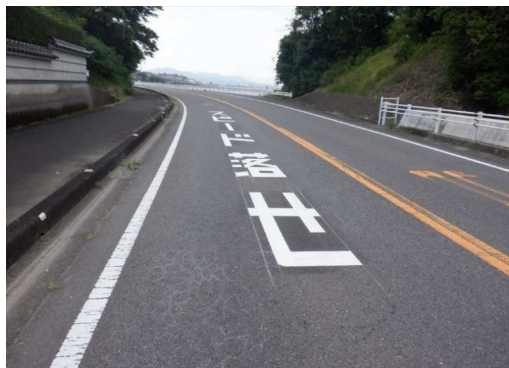
14. 七浦小学校 南側国道207号 「スピード落せ」の路面標示設置