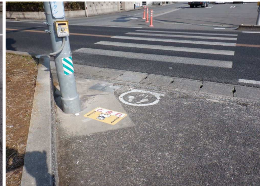
21. 明倫小学校 JAさが鹿島会館北口 (セブンイレブン前) 止まれシール張り直し