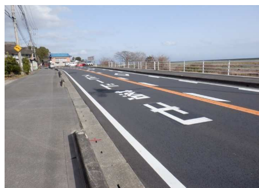
15. 七浦小学校 音成分校付近 「スピード落せ」の路面標示設置