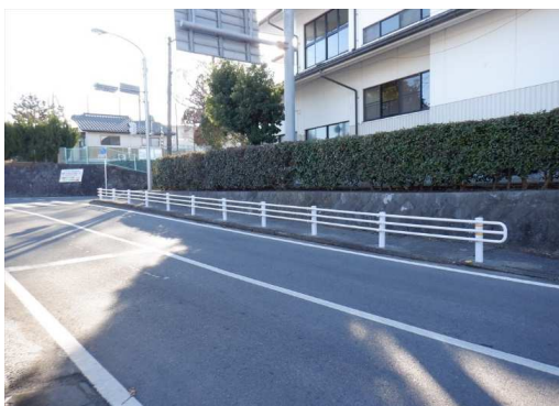
2. 鹿島小学校 三道会交差点 ガードレール設置