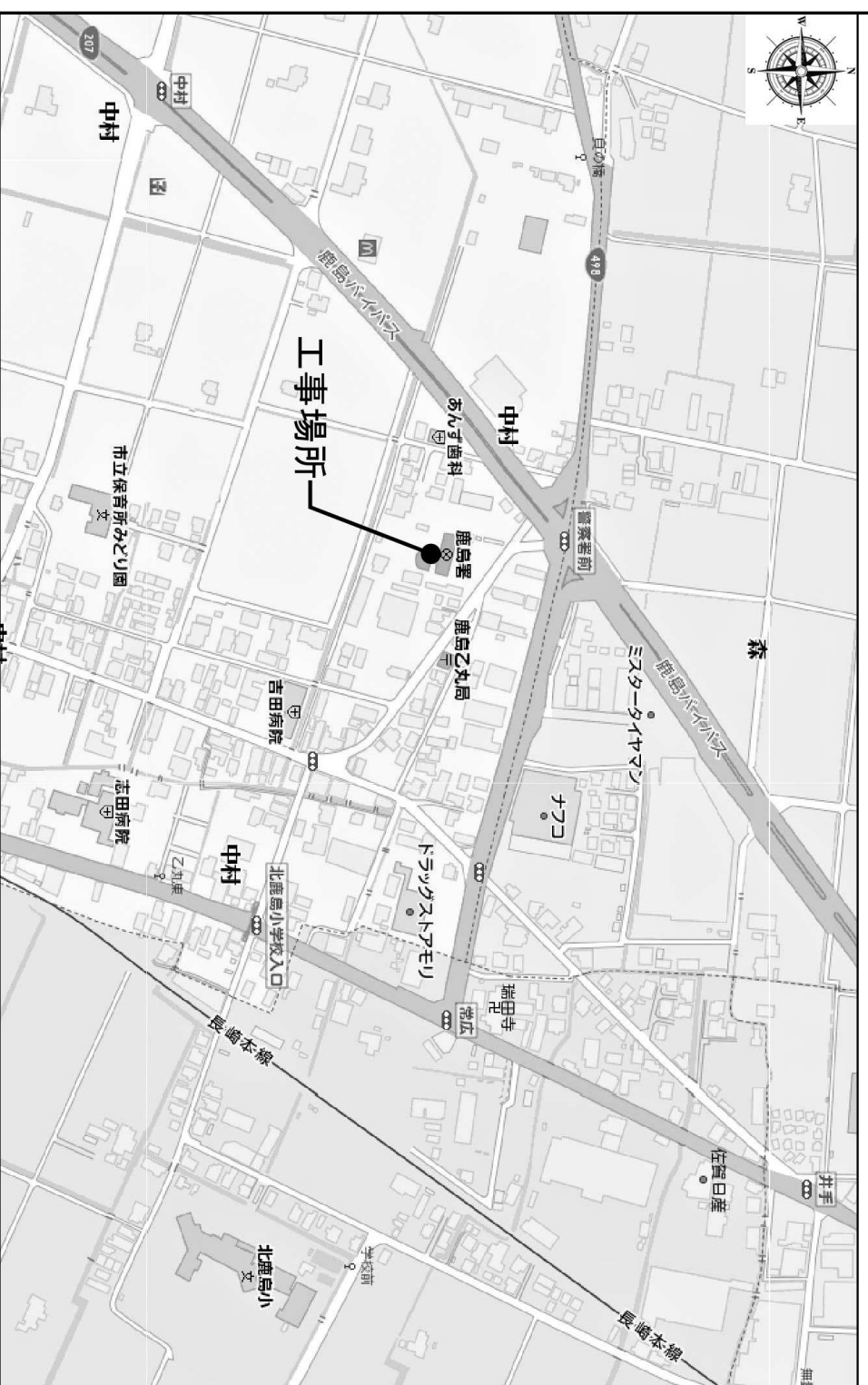
※1 下記建物は全て解体・撤去・処分