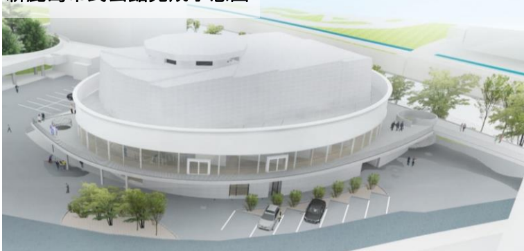
新鹿島市民会館完成予想図

地方公共団体が地方創生のために実施する事業に対し、企業様から寄附を行っていただくと、税の優遇が受けられる「地方創生応援税制」が創設されました。