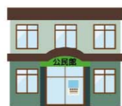
公民館等の公共施設