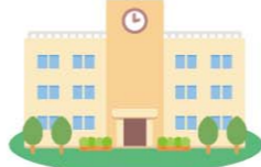
学校・体育館等の施設