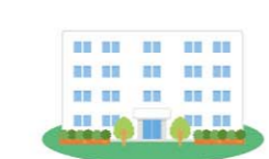
土砂災害に対する指定緊急避難場所の場合、安全な構造である堅牢な建物が指定されます。