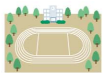
地震や大規模な火災等の場合、危険が及ばない学校のグラウンドや運動場が指定されます。