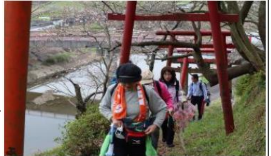
フットパス当日の様子

フットパスを通じた交流人口の増加や経済の活性化、地域資源の保全を目指し、新しいコースの選定や、マップの作成、モニターツアーの開催などに取り組みました。今後は、参加費収入等による自立的運営を目指します。