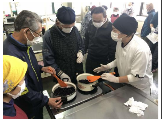
ブルーベリー加工の様子

今後は収穫量を増やし、「健幸長寿のまち」の取組として住民向けイベントの開催を目指すとともに、加工商品の販売に向けて取り組んでいきます。