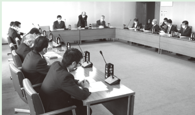
新型コロナウイルス感染症対策会議の様子