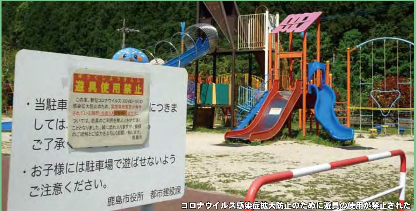
新型コロナウイルス感染症拡大防止のために遊具の使用が禁止された

発行／鹿島市議会 編集／議会だより編集委員会 〒849-1312 佐賀県鹿島市大字納富分2643番地1 TEL63-2104 FAX63-2314