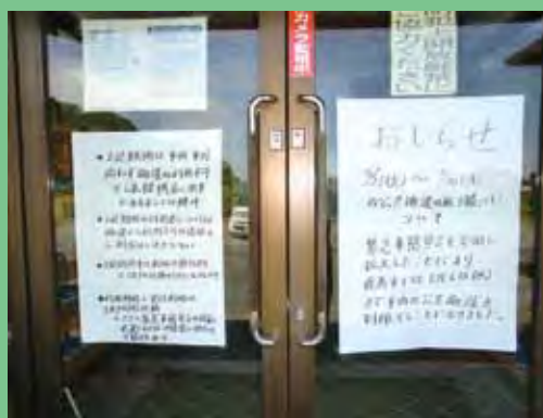
「今こそ、家めし!」のキャンペーンに協力する市内の飲食店(左)