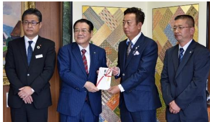
平川重機クレーン様