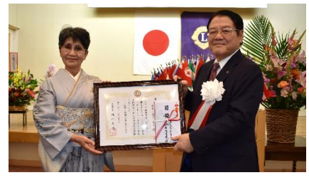
鹿島ライオンズクラブ様

11月は多くの企業・団体様からご寄附をいただきました。 新市民会館 や 子どもたちの健康 、 有明海の環境保全 などに有効に使わせていただきます。ありがとうございました。