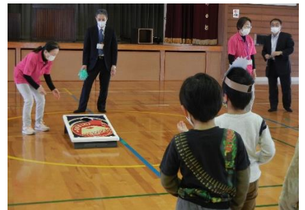
「バグゴ」を楽しむ七浦小の子どもたち

3月25日に七浦小学校体育館において、七浦小学校と音成分校の放課後児童クラブを利用している子どもたちが参加し「 バグゴ体験会 」が開催されました。通常の体験会は、 鹿島市レクリエーション協会 と 鹿島市社会福祉協議会 が連携して、 毎月最終土曜日 に市民交流プラザ「 かたらい 」で行われています。今回は、春休み期間中である市内小学校の放課後児童クラブに出張し、体験会が行われました。また バグゴ とは、 6m先のボードの穴 に「 ビーンバッグ (やわらかい袋に豆などを詰めたボール)」を投げ入れ得点を競うもので、子どもから高齢者まで幅広く遊べる軽スポーツです。子どもたちは、バグゴで競いながらも楽しく過ごしていました。