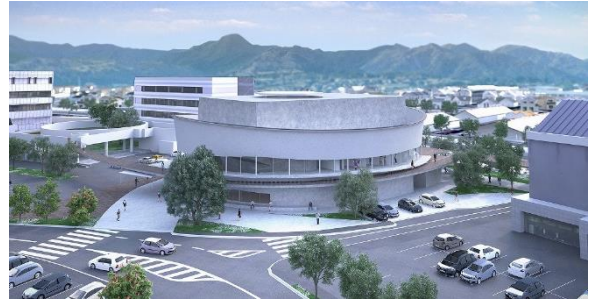
新市民会館完成予想CG

新市民会館の建設がいよいよ4月から始まります。3月9日に建築主体工事の入札を行い、事業者が決定し、新市民会館新築工事に係る 4工種(建築主体、電気、機械、舞台) 全ての事業者が決定しました。そして、3月24日に4工種の契約について市議会で議決されました。新市民会館は、4月に工事着工、約20か月後の 令和4年の秋に竣工する予定 です。新市民会館は、座席幅が旧市民会館より 8センチメートル広く設計 されており、ゆっくりと鑑賞していただくことができます。また、 舞台の広さとトイレの数 は、いずれも旧市民会館の 約2倍 となる予定です。