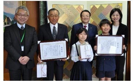
ストップ温暖化「県民運動功労者表彰伝達式」

地球温暖化防止対策に貢献したとして、 古枝小学校 と 鹿島市ラムサール条約推進協議会 の 2団体 が表彰され、3月1日に市長から表彰状と記念品を贈呈する伝達式が行われました。この表彰は、県や県内市町、民間団体でつくる 佐賀県「ストップ温暖化」県民運動推進会議 が、毎年度、地球温暖化防止対策に貢献した県内の個人や団体を表彰するものです。古枝小学校は、環境教育プログラムへの参加や 段ボールコンポストづくりによるごみ減量化 への取組、また、鹿島市ラムサール条約推進協議会は、ラムサール条約登録地で刈り取った ヨシを堆肥化し、循環型社会の構築に寄与 したことや堆肥を使った作物の売上の一部を有明海の環境保全に活用するなどの取組が認められての受賞となりました。おめでとうございます。