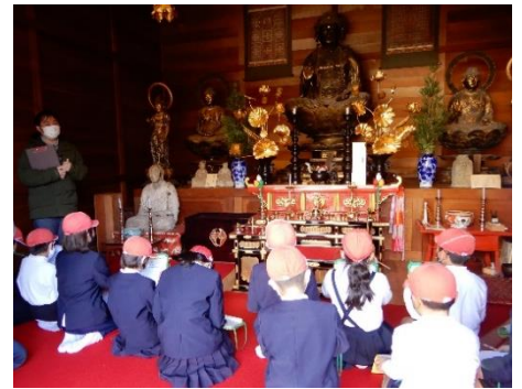
能古見の「蓮蔵院」で学んでいる能古見小3年生

鹿島市の面積の 半分以上 を占める 能古見地区 には、広大な自然と多くの史跡や名所、伝統芸能が残っており、中には 国や市の重要文化財に指定 されているものもあります。今回のプロジェクトは、そのような地域の宝について学び、今後の地域文化の継承、地域へ参画するきっかけとするため、地元の 能古見小学校3年生 を対象に「総合的な学習の時間」として企画され 全3回 にわたって行われました。能古見地区全体を撮影したドローン映像や現地を巡り学び、最後に能古見地区の歴史について「 かべ新聞 」を作りました。