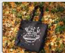
寄附金額10,000円 猫バック 黒