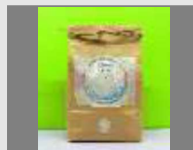
寄附金額5,000円 ラムサール米 2kg