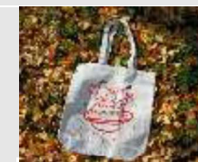
寄附金額10,000円 猫バック 白