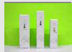
寄附金額10,000円 幸姫 化粧品 いずれか1つ