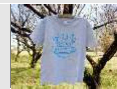
寄附金額10,000円 猫Tシャツ