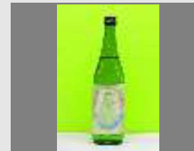
寄附金額10,000円 幸猫限定酒+ラムサール米