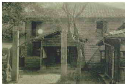
▲古枝村役場（昭和3年頃）

古枝地区は、多良山系に源流をもつ浜川に沿って、南北に細長く伸びた地域です。この地区の人々は、昔から、荒ぶる浜川を畏れ、浜川がもたらす恵みに感謝し、それを活用し、またともに流域を生きる浜地区や七浦地区とも歴史的に密接な関係を維持してきました。