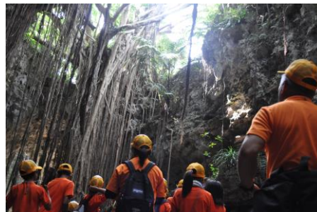
▲ 神秘的な木「ガジュマル」を 見上げ、南の島の自然を感じる。