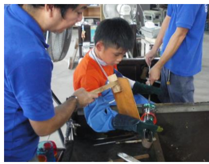
▲ 琉球ガラス作り体験