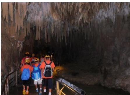
▲ 未知なる洞窟探検に出発!