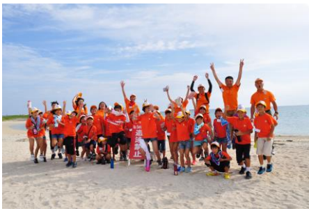
▲ 青い海と空をバックに みんなでジャンプ!