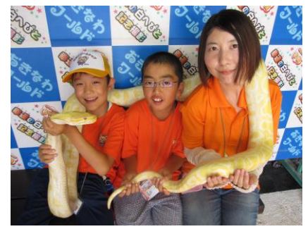
▲ 幸運の白へびにも出会えます!