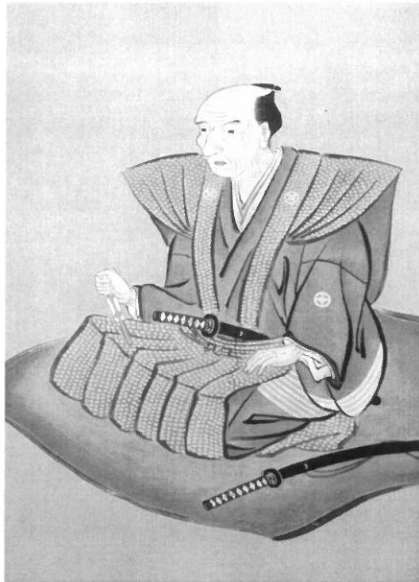
伊能忠敬像(伊能忠敬記念館蔵)