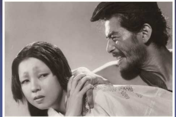
『羅生門』 [1950年] 出演者/三船敏郎、京マチ子 他