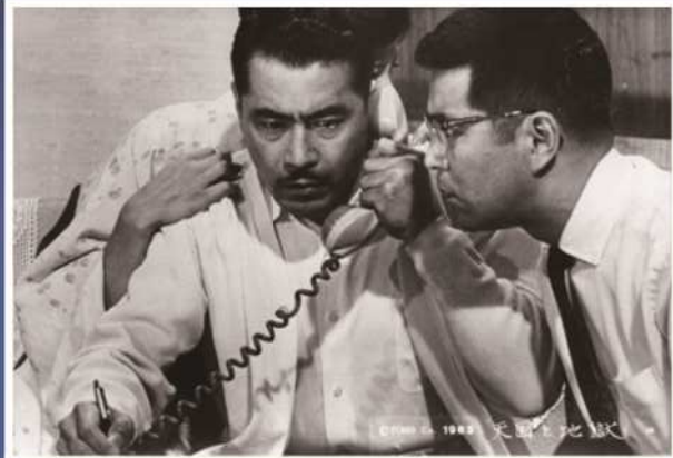
『天国と地獄』 [1963年] 出演者/三船敏郎、仲代達矢 他