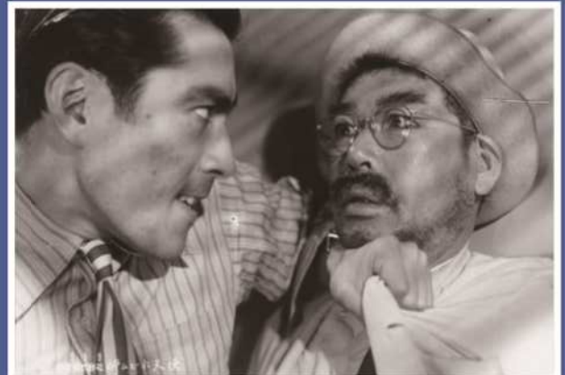
『酔いどれ天使』 [1948年] 出演者/志村喬、三船敏郎 他