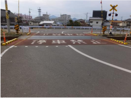
1. 犬王袋交差点(犬王袋側)