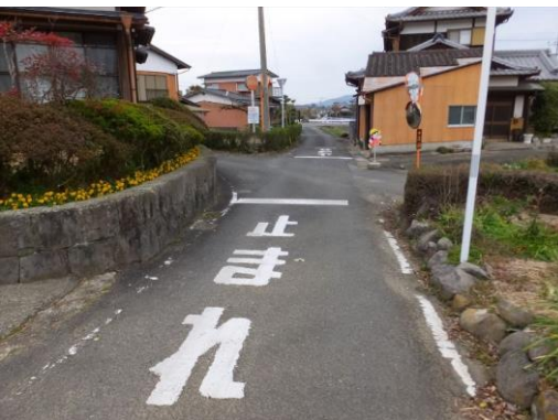
3. やまだ整体療術院裏の4差路