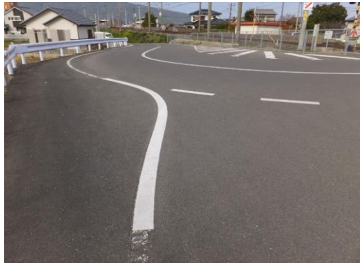
1. 犬王袋交差点(中牟田側)