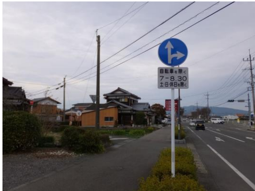
4. 通行規制の標識設置