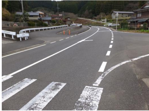
2. 三源寺トンネル横断歩道