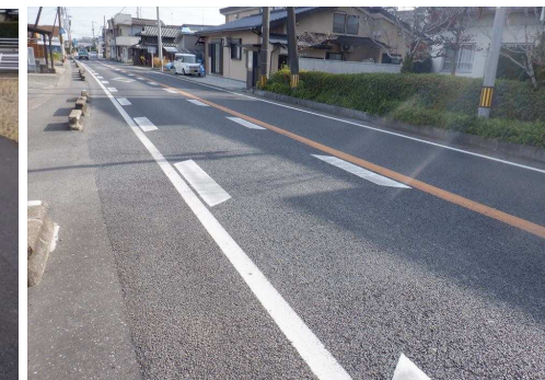
9. 明倫小学校 国道207号執行分団地付 近横断歩道前後に減速マーク設置