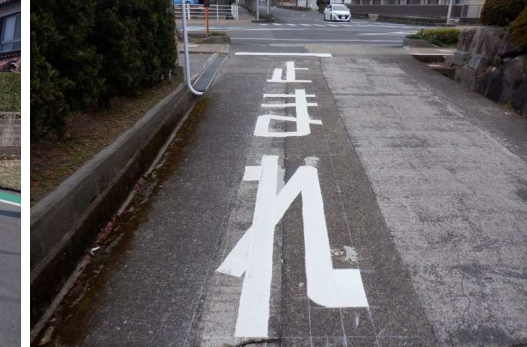
11. 明倫小学校 祐徳温泉横 「止まれ」の路面標示補修