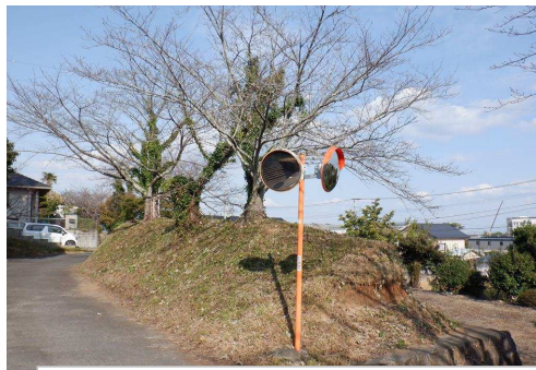
5. 鹿島小学校 旭ヶ岡公園階段下 カーブミラー増設