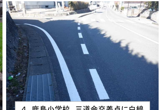
4. 鹿島小学校 三道会交差点に白線 設置