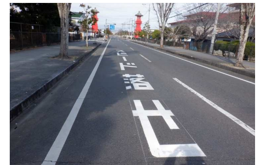
7. 古枝小学校 学校前県道 「スピード落とせ」標示