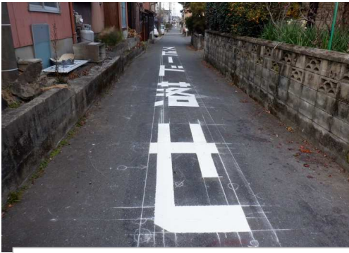
12. 明倫小学校 執行分公民館前の市道 「スピード落とせ」の路面標示補修