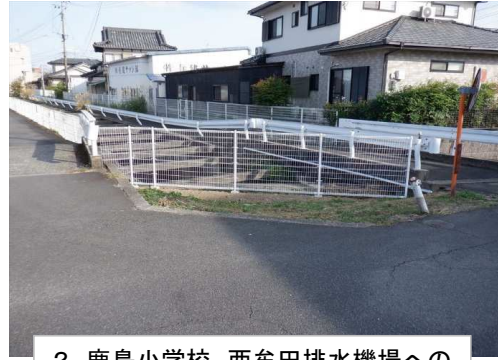
2. 鹿島小学校 西牟田排水機場への 水路に転落防止柵設置