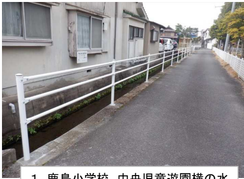
1. 鹿島小学校 中央児童遊園横の水 路に転落防止柵設置