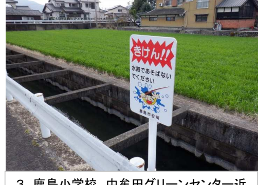
3. 鹿島小学校 中牟田グリーンセンター近 くの水路に注意喚起看板2カ所設置