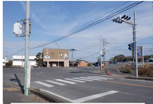
6. 古枝小学校 国道207号バイパス 大村方交差点歩行者用信号時間延長