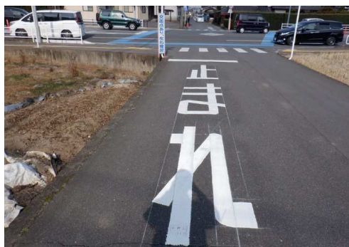
8. 古枝小学校 中村医院付近 「止まれ」の路面標示補修