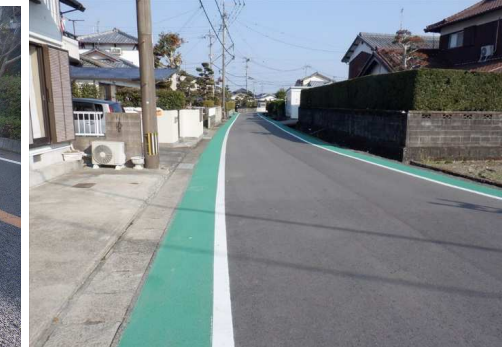
10. 明倫小学校 馬渡公民館付近 カラー舗装設置