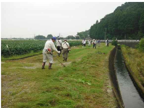
南川 農道の草刈り H29.9.23