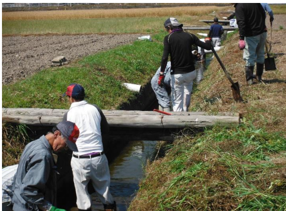
伏原 水路の泥上げ H29.5.28