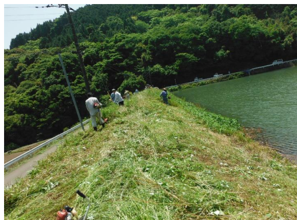
筒口 ため池の草刈り H29.5.14