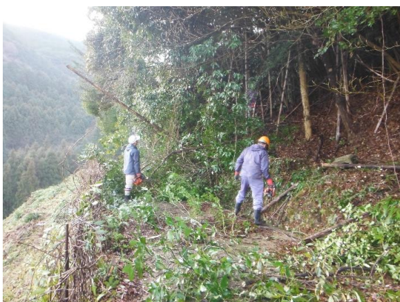
大野 被り木伐採 H30.3.4