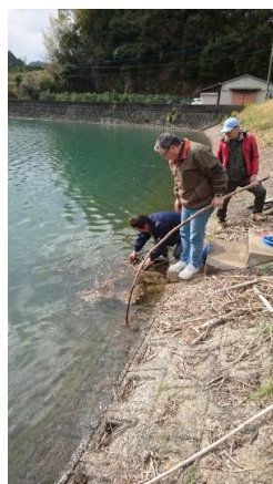
筒口 施設の点検・機能診断 H29.4.2