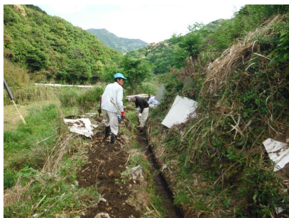
早ノ瀬 水路の泥上げ H29.9.20