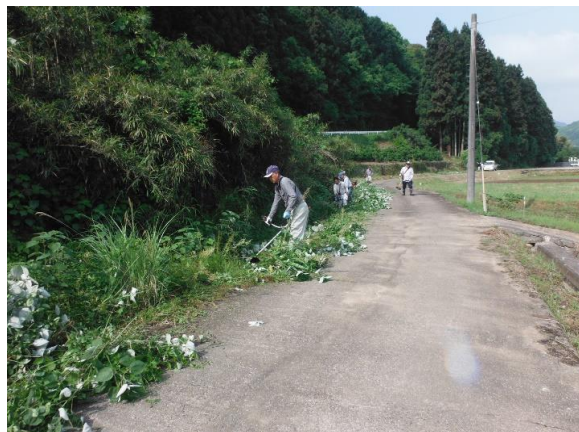
筒口 農道の草刈り H29.5.14