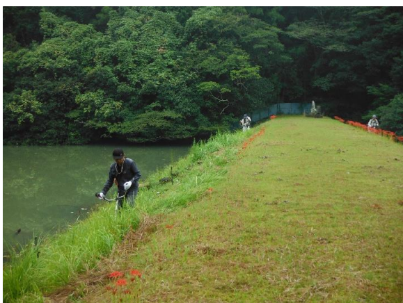
中浅浦 ため池の草刈り H29.9.20