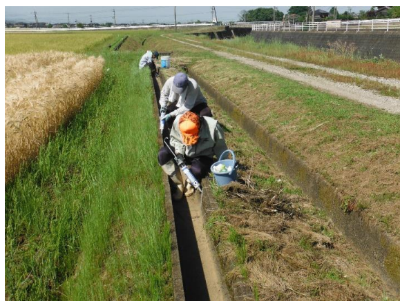
南川 U字溝目地詰め H29.5.14