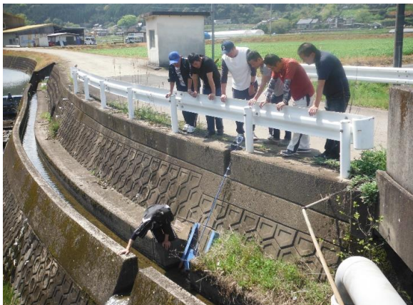
伏原 施設の点検・機能診断 H29.4.16