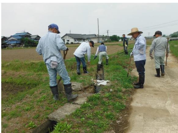
筒口 田植前の通水試験 H29.6.11