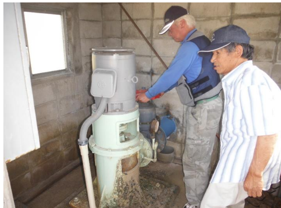
伏原 施設の点検・機能診断 H29.4.16