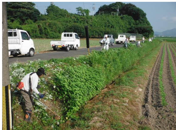
伏原 農道の草刈り H29.7.30