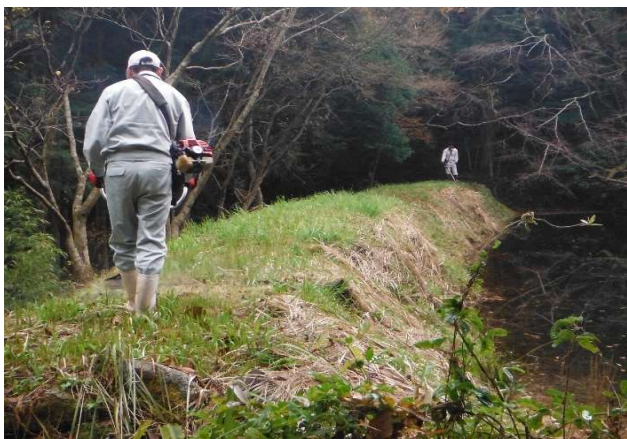
大野 ため池の草刈り R1.12.1