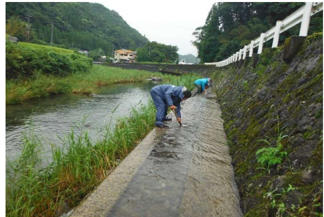
西三河内 水路の泥上げ R1.9.1