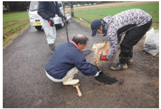
伏原 農道の路面維持 R2.1.26