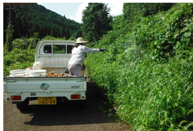
白鳥尾 きめ細やかな雑草対策 R1.5.26