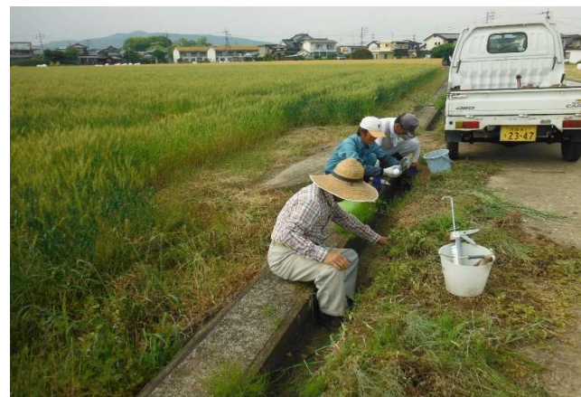
南川 水路目地詰め R1.5.12