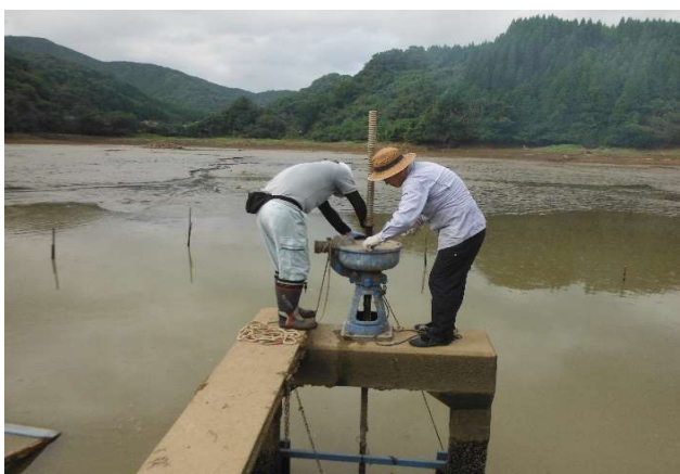
筒口 施設の適正管理 R1.9.14