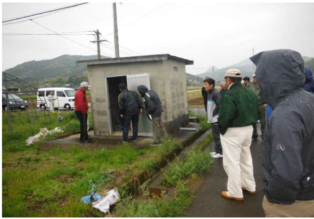
伏原 施設の点検・機能診断 H31.4.14