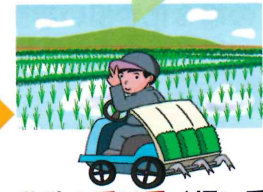
農地の受け手（担い手）