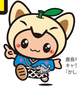
鹿島市イメージ キャラクター 「かし丸くん」