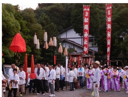
肥前浜宿に息づく人々の営みにみる歴史的風致

鹿島市歴史的風致維持向上計画では、鹿島市内に見られる4つの風致を取り上げ、その歴史や伝統を紹介するとともに、市内に残る歴史的建造物や伝統的な活動の存続を支援する事業を計画しています。詳細は別紙の概要資料に記載しています。