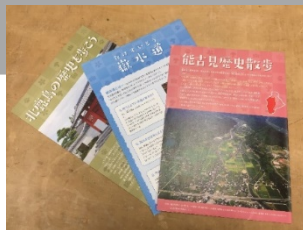
「歴史さんぼシリーズ」の一部

本事業では、市内の各地区の歴史や文化を分かりやすく伝えるためのガイドブックである「歴史さんぼシリーズ」の作成を継続して行っていく。また、これまでのシリーズと合わせた統合版を作成し、鹿島市の歴史や文化についての認知向上を図る。