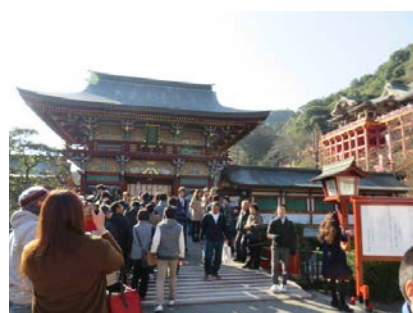
祐徳稻荷神社参拝と地域の営みにみる歴史的風致