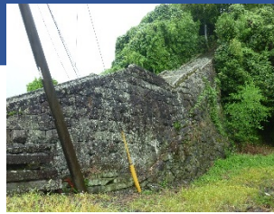
歴史的風致形成建造物の候補

伝統的建造物群保存地区を除く重点区域全域において、歴史的風致形成建造物に指定された建造物についての保存修理を実施する。これにより、これまで指定等が行われていなかった歴史的建造物の保存・活用を推進し、歴史的風致の維持及び向上につなげる。