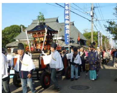
鹿島城址と琴路神社の祭りにみる歴史的風致