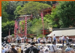
かしま伝承芸能フェスティバル

本事業では、市全域に分布する浮立や獅子舞といった民俗芸能をはじめとした伝承芸能を披露する場として、祐徳稲荷神社境内において「かしま伝承芸能フェスティバル」を開催し、民俗芸能の技術伝承および市内外の見物客への認知向上につなげる。