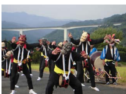
浮立と獅子舞にみる歴史的風致