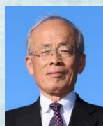
太宰府市副市長 清水 圭輔 氏