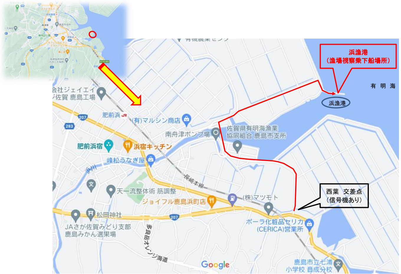
駐車場から、集合場所までの経路図