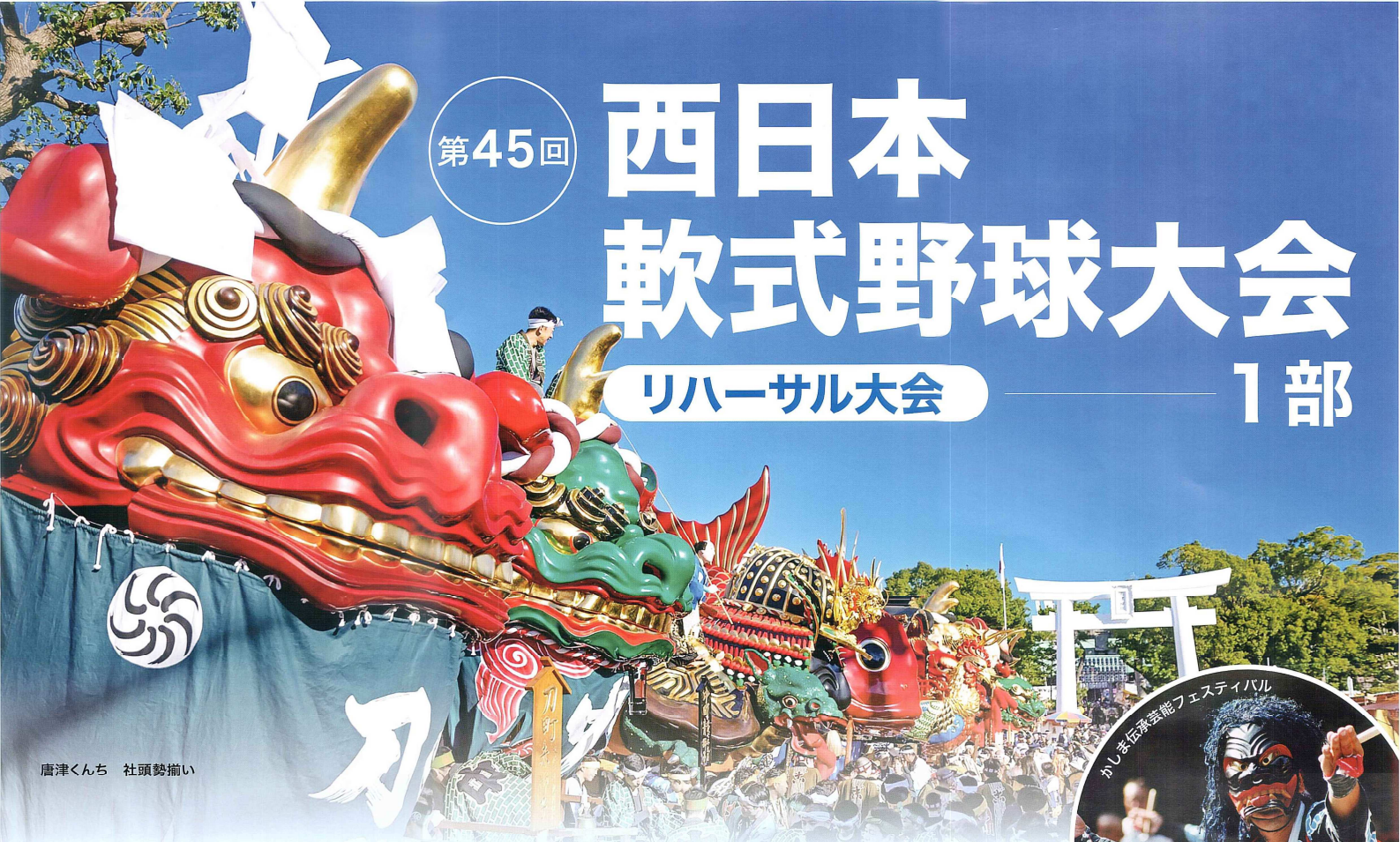
唐津くんち 社頭勢揃い