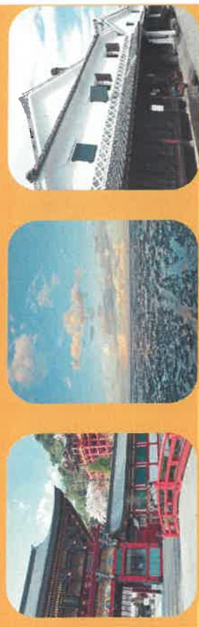
予LJ17・L17内・L17外(修業年限科目一総合科目(集中履修)) Challenge Internship B (General Education Course - Comprehensive Subjects: Intensive Courses)

[Eligibility] Saga University Students [Participants] Japanese Students 12 ppl International Students 8 ppl *In case of too many applications, we will hold a draw for place allocation [Fee] Free [Application Deadline] Oct. 5th 12pm [Outline of Program] Pre-training : Learn how to preserve and inherit regional tradition and the current situation of Kashima City Kashima Trip : Visit and explore Kashima City and find a charm point. Take photos and videos for an assignment. Post-training : Produce poster and video clip and conduct presentation at Kashima Municipal Office.