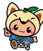
鹿島市キャラクター「かしまる」くん