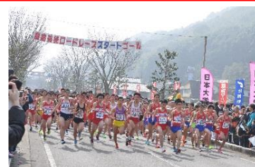
祐徳ロードレース(H29.2月)

今年の祐徳ロードレースに招待選手として出場された 道下美里 選手(三井住友海上所属)が、ロンドンで開催された「2017 世界パラ陸上マラソンワールドカップ」に出場され、3時間0分50秒で 金メダル に輝かれました。祐徳ロードレースに出場した選手が活躍されることは、大変嬉しいことです。他にもスポーツ合宿をされた学校や選手など鹿島に縁がある方の今後の活躍をお祈りいたします。