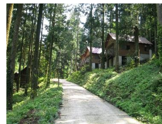
奥平谷キャンプ場