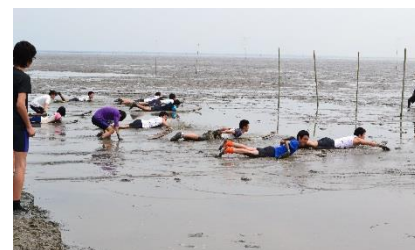
干潟体験の様子(ガタスキー)