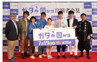
ドラマ出演者(出演者会見)

【放送予定日時】平成29年7月19日(水)10:00~10:59(59分) NHK BSプレミアム