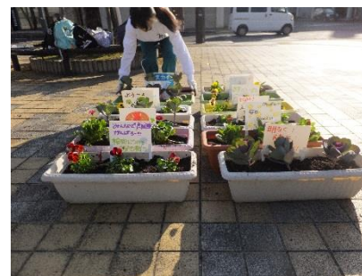
高校生の「想い」を添えたプランター

11月10日、 鹿島実業高校・鹿島高校の生徒・PTA・先生 による「花ボラ」と中心商店街の合同で「まちなか花いっぱい運動」が開催されました。集まった 生徒約110人、商店街関係者約40人 の参加者は、鹿島駅前から商店街一帯の除草と清掃活動に加え、公園の花壇やお店の前のプランターに花を植えました。例年2回の作業を行い、今回は、 デージー や ハボタン などの花苗を 約800本 植え込み、 高校生の「想い」 をプレートに書いてプランターに添えてもらいました。花苗とプランターに書いてもらった高校生の「想い」が大きく花を咲かせることを願います。