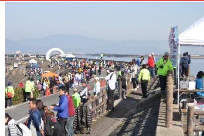
肥前鹿島干潟リレーマラソンの様子

11月11日、 ラムサール条約登録湿地「肥前鹿島干潟」 の登録 3周年 を記念し、新籠海岸に整備したウォーキング・ジョギングコースのお披露目かねて リレーマラソン大会 を開催しました。当日は、秋晴れのもと、市内外から 61チーム319人 が参加され、参加者は思い思いのペースで、有明海が望めるすばらしいコースを楽しまれました。 豚汁のふるまい や 選手への声援 など おもてなしの心 で大会を支え、盛り上げていただいた地域の皆様やボランティアの皆様には大変感謝しております。