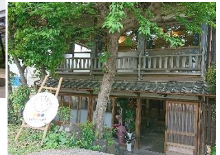
ゲストハウス「あんど」(下)