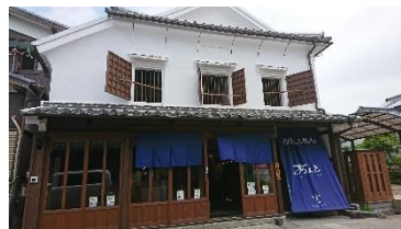
ゲストハウス「まる」(上)

4月26日、肥前浜宿に ゲストハウス2軒 と そば屋 がオープンしました。1軒は、肥前浜駅前通り沿いの旧旅館を改修した「 まる 」で、もう1軒は、酒蔵通り沿いの伝統的建屋を活用した 女性専用 の「 あんど 」です。2軒合わせて30人ほどの宿泊が可能となっています。また、「あんど」の1階には、手打ちそばと角打ちのお店「 龍庵 」も同時にオープンしました。このゲストハウスは、国の補助金を活用し、地元の「 肥前浜宿まちづくり公社 」が開設したものです。待望の宿泊施設により、観光拠点である肥前浜宿の魅力がさらに高まり、鹿島市への滞在時間の増などが期待されます。