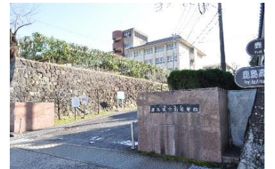
鹿島実業高等学校校門