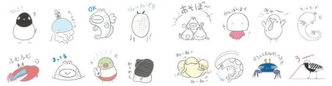
有明海のいきものLINEスタンプ 16種類

鹿島市のラムサール条約推進室では、 有明海 の 環境保全 に関心をもってもらうために、 有明海のいきものLINEスタンプ を作成しました。スタンプの種類は、ムツゴロウやシオマネキ、スナメリなど全部で 16種類 です。LINEアプリ内のスタンプショップで購入できます。スタンプの売上の一部は有明海の環境保全のために利用されることになっています。ぜひご利用ください。