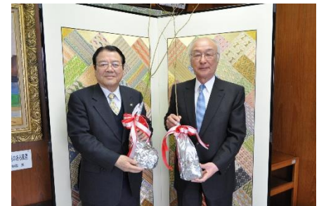
寄附贈呈式の様子

3月4日、佐賀トヨペット株式会社から苗木のご寄附をいただきました。これは、佐賀トヨペット株式会社が 昭和51年度から地域環境保全活動「トヨペットふれあいグリーンキャンペーン」 として取り組まれているもので、鹿島市へのご寄附は、平成26年度に続き 2回目 となります。今回、 海の森事業 への寄附としていただいた モミジ、ケヤキの苗木330本 は、市有林へ植林させていただきました。海の森事業とは、保水力や土砂の流出防止に高い能力をもち、海の浄化にもつなげるために、 毎年、広葉樹の植林を行っている事業 です。苗木のご寄附大変ありがとうございました。