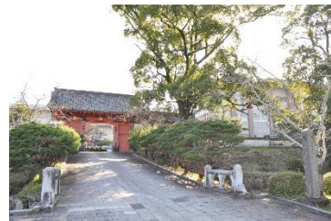
鹿島高等学校校門

3月1日、県立高校の再編に伴い、閉校となる 鹿島高校 と 鹿島実業高校 の 閉校式 が行われ、 鹿島高校 は昭和23年から 72年 、 鹿島実業高校 は昭和30年から 65年 の歴史に幕を下ろしました。式では、最後の卒業生や同窓生が参列し、校歌斉唱や校旗の引継ぎなどが行われ、 それぞれの伝統や精神が新設された鹿島高校へと引き継がれました。