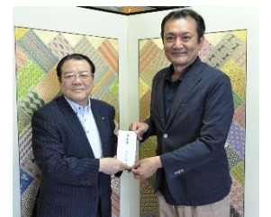
大村市モーターボート競争事業 様 公益財団法人B&amp;G財団 様