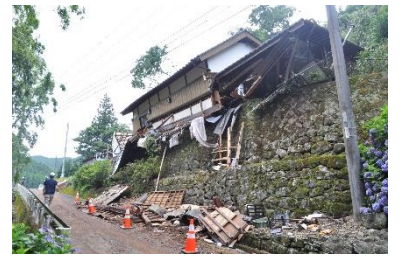
土砂崩れによる家屋倒壊