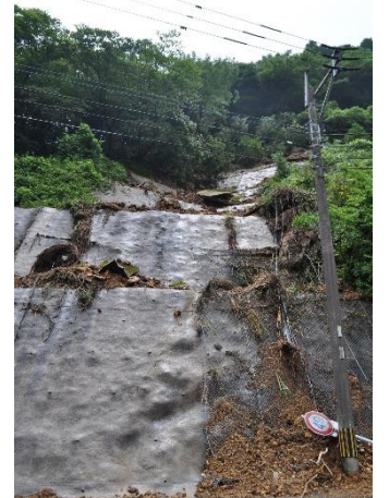
国道444号のり面崩落 (能古見地区山浦平谷)