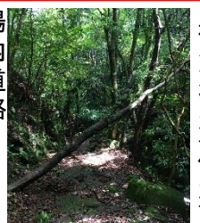
キ ャ ン プ 場 の 被 災 状 況 ( 倒木 )