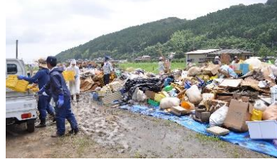
災害 受け入れ 作業