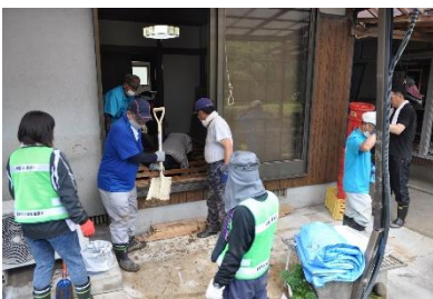
ボ ラン テ ィ ア な 泥 出 し