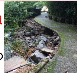
の 場 内 道 路 の り 面 崩 落 ←

市の能古見地区平谷にある「 奥平谷キャンプ場 」は、夏場になると、毎年市内外から多くのお客様で賑わいます。しかしながら、今回の豪雨の被害により、本年は キャンプ場を閉鎖 します。キャンプ場への アクセス道路 であり、長崎県大村市とをつなぐ 一般国道444号のり面(平谷地区:平谷物産直売所付近)の崩落 により、現在も 通行止め となっていることやキャンプ場内では 道路のり面崩落 や 倒木 などの被害が発生しているため、利用者の皆様の安全を考慮して判断しました。ご利用を計画されていた皆様にはご迷惑をおかけします。