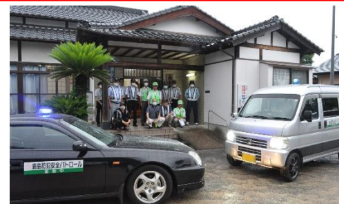
鹿 島 防 犯 安 全 パ ト ロ ー ル 発 足 式

鹿島は色々なことに取り組んでいます。全国の方に鹿島を知ってもらうために、みなさんも、SNSで広めてください。