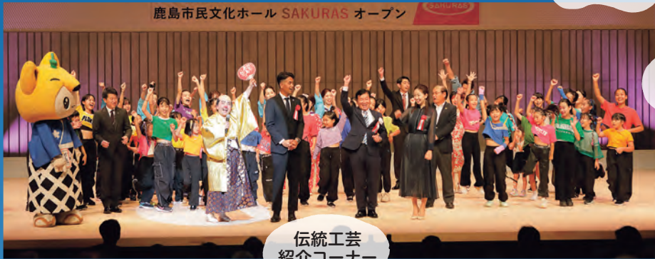
鹿島市民文化ホール SAKURAS オープン