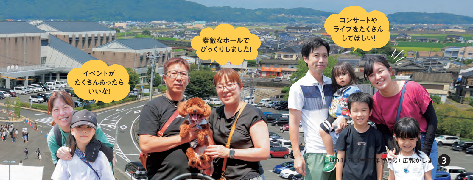
イベントが たくさんあったら いいな!

多くの皆様にご支援、ご協力をいただきまして、鹿島市民文化ホールは開館することができました。本当にありがとうございます。ここは、文化芸術の交流の場、市民の皆さんがお互いの親睦を深める場です。市民の皆さんはもとより、市外、県外の方々など、多くの方々にご利用いただきたいと思います。