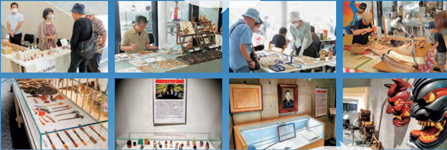
ふるさと資料館 展示