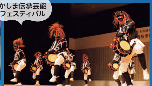
かしま伝承芸能 フェスティバル