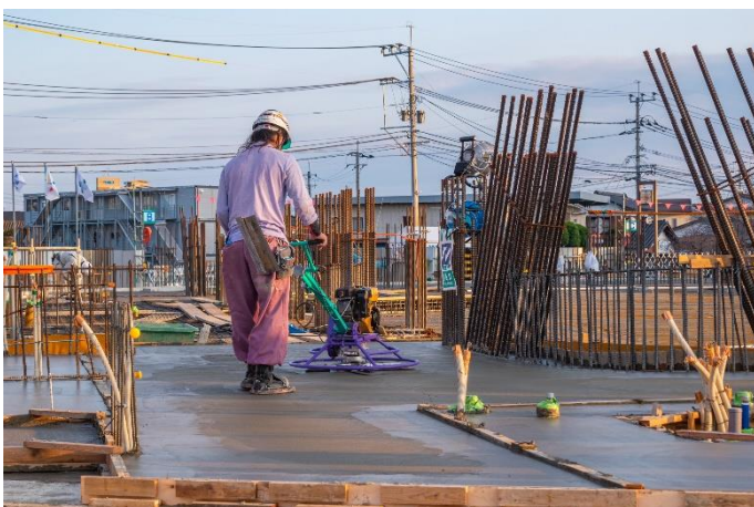
←打設後の左官仕上げの様子