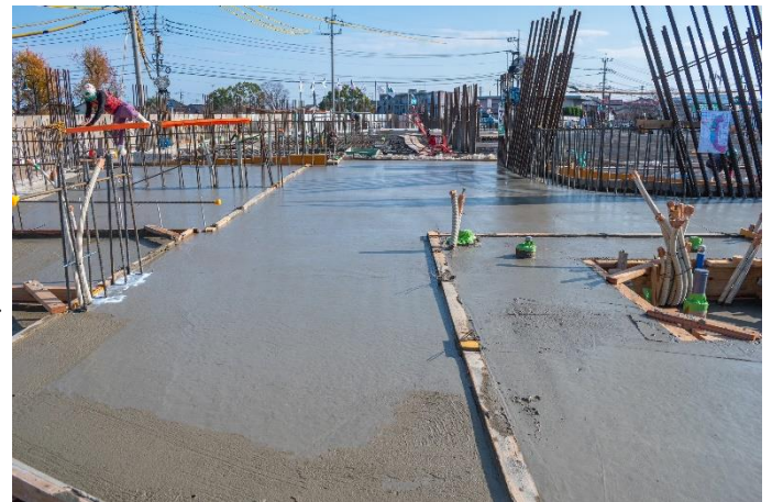
床コンクリートの打設後の様子→