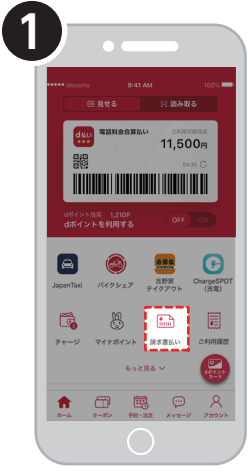
1 d払いアプリから請求書支払いを選択