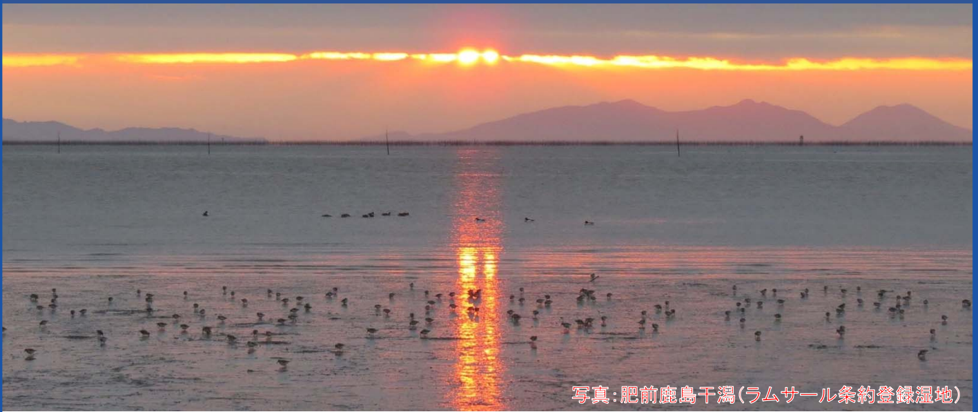
写真: 肥前鹿島干潟(ラムサール条約登録湿地)