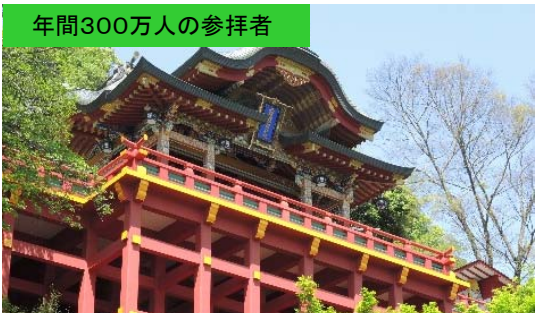
年間300万人の参拝者