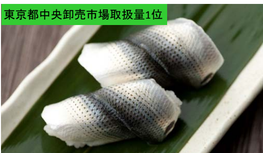
東京都中央卸売市場取扱量1位