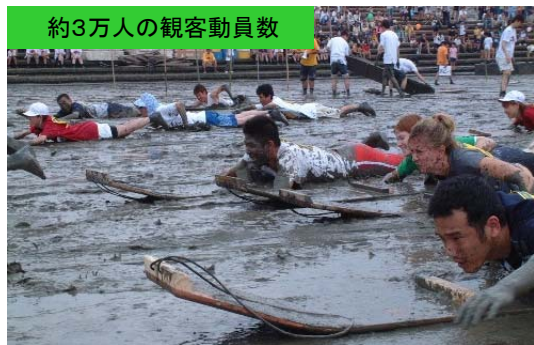
約3万人の観客動員数