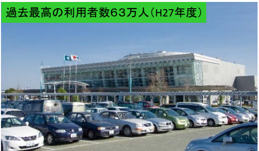
過去最高の利用者数63万人(H27年度)