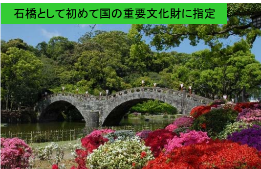
石橋として初めて国の重要文化財に指定