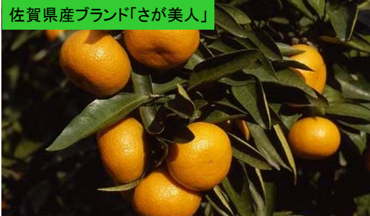
佐賀県産ブランド「さが美人」