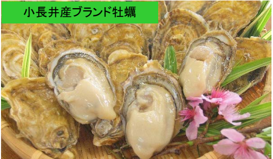
小長井産ブランド牡蠣