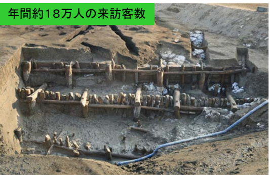
年間約18万人の来訪客数