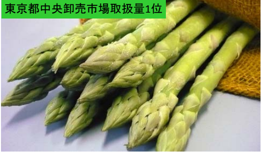
東京都中央卸売市場取扱量1位