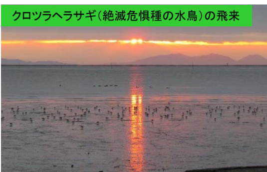
クロツラヘラサギ(絶滅危惧種の水鳥)の飛来