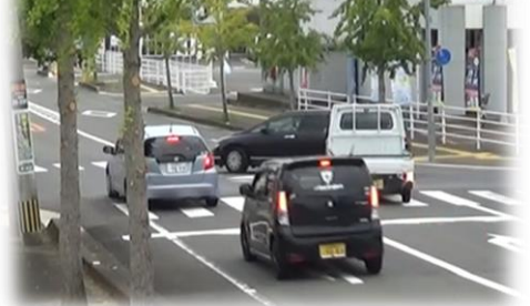
右折車による「ヒヤリハット」状況