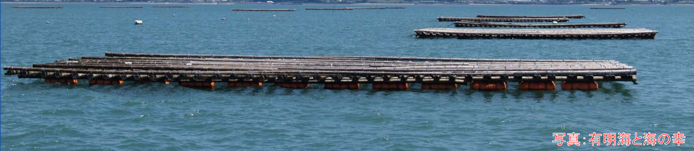
写真：有明海と海の幸