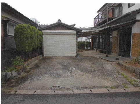
車庫・駐車スペース