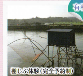
柵じぶ体験(完全予約制)

「むつかけ」とは、干潮時に干潟の上で活動するムツゴロウに針をかけて捕る伝統漁法です。