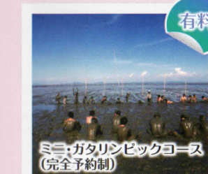
ミニ・ガタリンピックコース(完全予約制)

鹿島ガタリンピックの競技を体験できます。入賞者にはガタリンピック特製の賞状やメダルをプレゼントします。