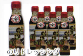
のりドレッシング

地元の「つまんでご明」を使った、菓子工房特製のシフォンケーキです。季節ごとに様々な味が味わえます。