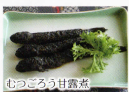
むつごろう甘露煮

有明海の干潟の差を利用して作られる有明海苔は、日本一の海苔として、その名を知られています。