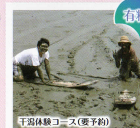
干潟体験コース(要予約)

鹿島ガタリンピックの競技を体験できます。入賞者にはガタリンピック特製の賞状やメダルをプレゼントします。