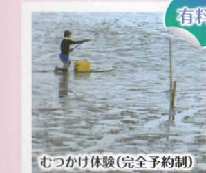
むつかけ体験(完全予約制)

個人、家族、小グループ向け。干潟の遊び方レッスン後、自由に遊べます。土曜・日曜・祝日・夏休み期間中は予約なしで体験出来ます。ただし、10人以上は予約が必要です。