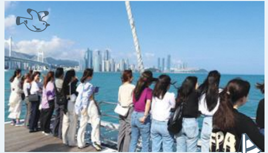
☆ 釜山シティツアー