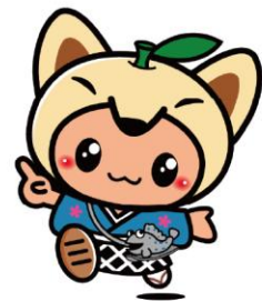
鹿島市イメージキャラクター 「かし丸」くん

男女共同参画社会基本法第2条に「男女が、社会の対等な構成員として、自らの意思によって社会のあらゆる分野における活動に参画する機会が確保され、もって男女が均等に政治的、経済的、社会的及び文化的利益を享受することができ、かつ、共に責任を担うべき社会」と規定されています。