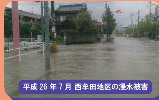
平成26年7月西牟田地区の浸水被害

外水氾濫(洪水による浸水)と内水氾濫(内水による浸水)の違いは、上の図に示すように浸水の発生する仕組みが異なります。内水による浸水被害は、洪水に比較し発生頻度が高く近年では大きな被害も報じられています。また、内水による浸水が洪水による浸水の前段階となる場合もあるため、早めの避難を心掛けることが大切です。