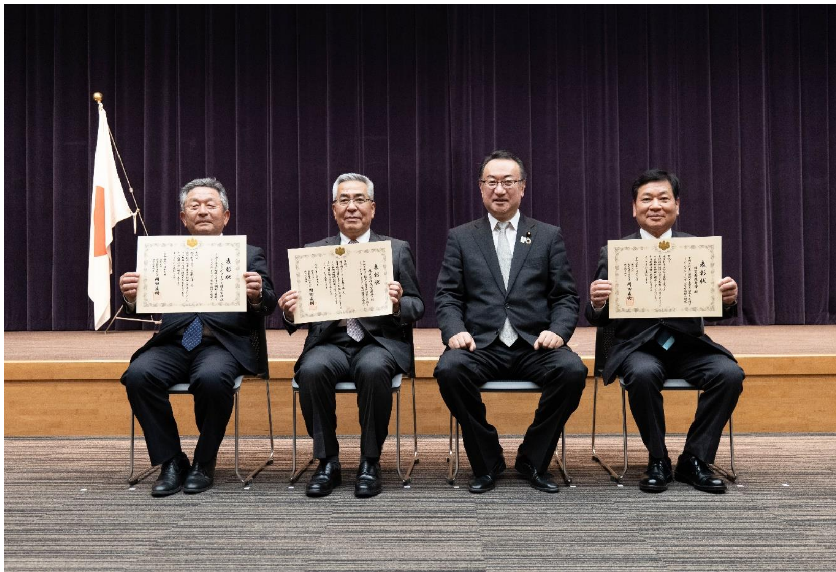
(写真 右から松尾市長、岡田内閣府特命担当大臣、坂井佐賀銀行頭取、さぎんコネクト富永代表取締役)