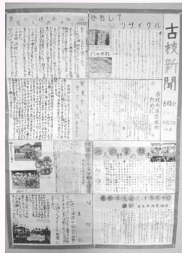
古枝小学校の壁新聞

「歴史の楽しさを教えられる社会の先生になる」という夢に向かって、ライバルである姉に負けないように、がんばります。