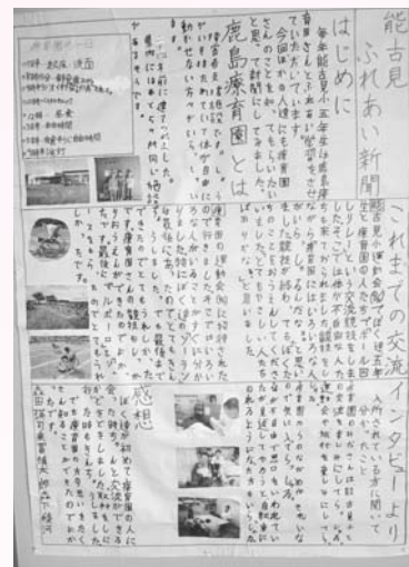
能古見小学校の壁新聞

幸いなことに父が設計士なので、そこに来店した人が嬉しくなるような、すてきな店を設計してもらおうと考えています。