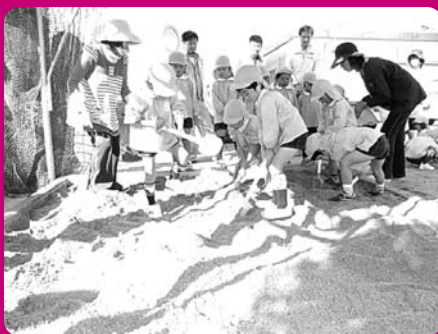
シャベルでかき混ぜる作業のお手伝いをする鹿島保育園の園児ら