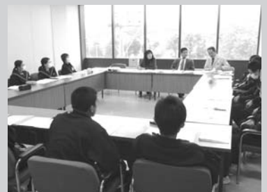
▶平成21年度の取り組み 6月 市民アンケート 10月 市外、県外アンケート 11月 西部中学生まちづくり懇談会 12月 高校生まちづくり懇談会 12月 東部中学生まちづくり懇談会 1月 大学生まちづくり懇談会 ▶平成22年度の取り組み ・市議会全員協議会への説明 (8月および10月) ・意見公募(パブリックコメント) (10月1日～12日)