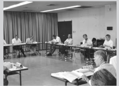
鹿島市総合計画審議会の開催 8月27日 第1回審議会 9月10日 第2回審議会 9月28日 第3回審議会 10月12日 第4回審議会 10月28日 第5回審議会 11月5日 第6回審議会 (全6回開催)