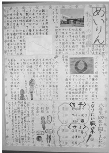
明倫小学校の壁新聞