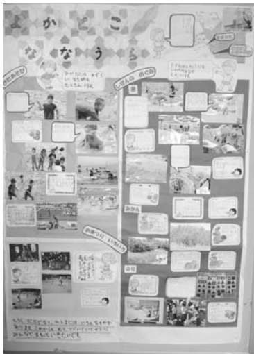
七浦小学校の壁新聞

私はまだ中学1年生で、勉強に部活、習いごとと、普段の生活だけでいっぱいになってしまっています。けれど「ファッションデザイナーになる！」という大きな夢に向かって、一步一步ゆっくりと、でも着実に進んで行きたいです。そして、デザイン画を見てくれた人も、できあがった洋服を着てくれた人も幸せに出来る「ファッションデザイナー」になりたいです。