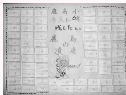
鹿島小学校の壁新聞

そんな私の将来の夢は「音楽りょうほう士」になる事です。私の演奏や楽しい音楽でたくさんの人に勇気や元気をあたえたり、おもわず笑顔になるような、心があつたかくなるような音楽を届ける。そして両親や周りの友達いろんな人達に感謝し、日々努力する事の大切さを忘れず夢に向かってがんばりたいと思います。