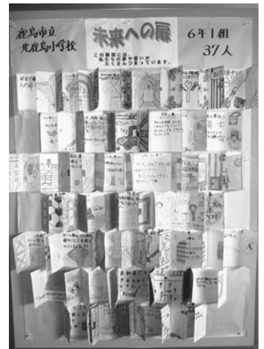
北鹿島小学校の壁新聞