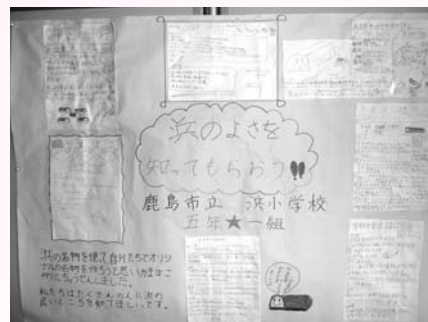
浜小学校の壁新聞