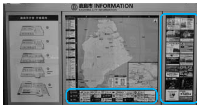
↑ ↑ 企業名および写真掲載場所