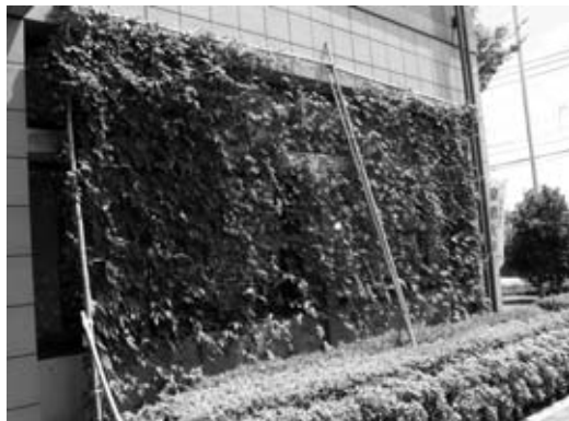
毎年取り組まれている市民図書館のグリーンカーテン