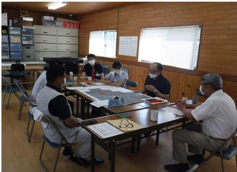
▲ 意向調査結果を踏まえた関係機関との打合せ・検証